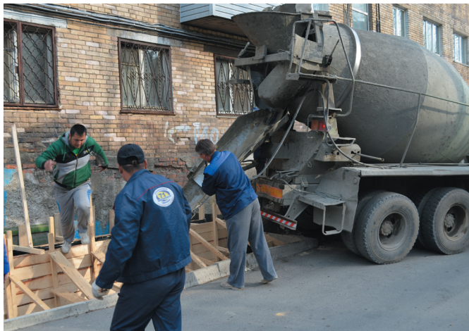
Ул. Кузнецова, 60: сходы в подвал

Итак, с начала 2014 г. выполнены работы по улицам: