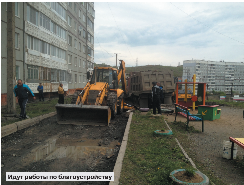
Идут работы по благоустройству