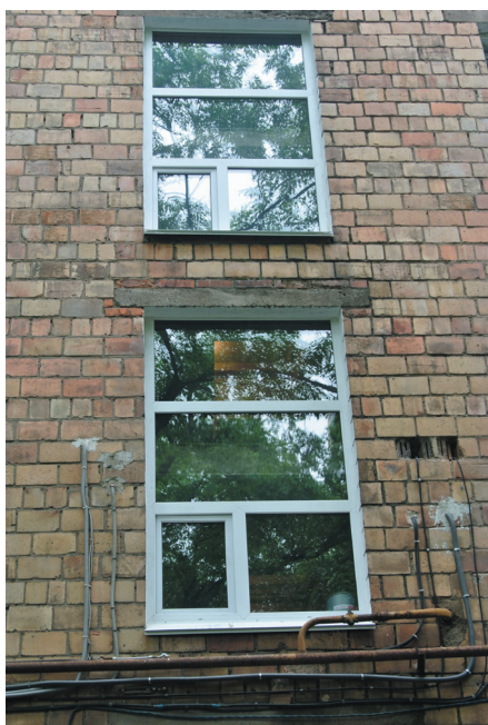
Ул. Фадеева, 6: отопление лестничной клетки