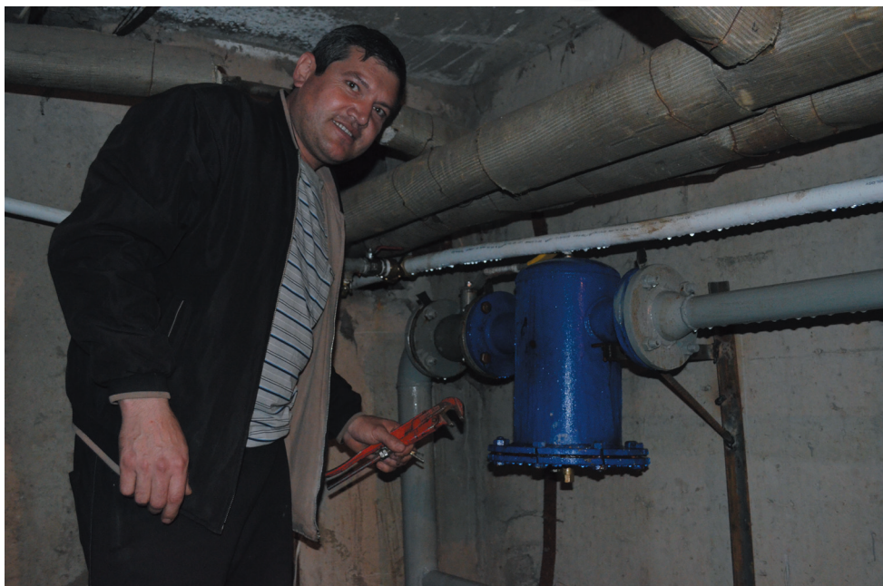
Ул. Каплунова, 23: розлив холодного водоснабжения