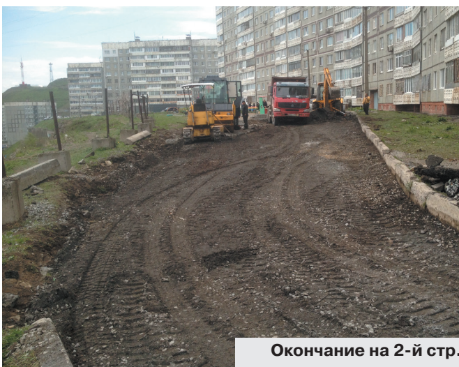
Окончание на 2-й стр.