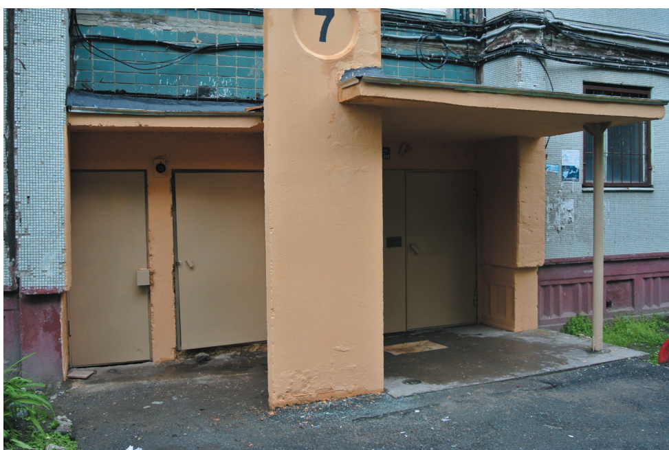
Ул. Каплунова, 8: ремонт подъездов