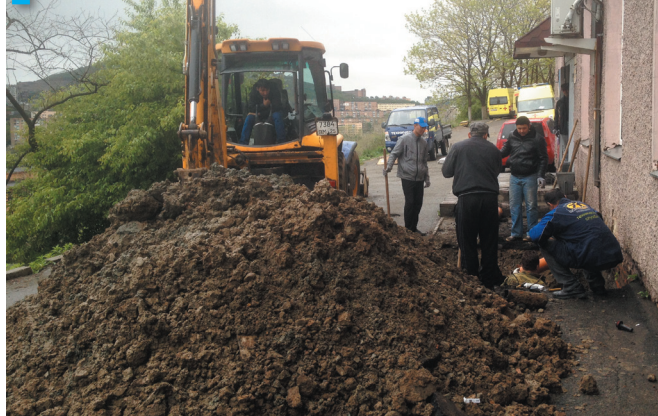
Ул. Кузнецова, 72: ремонт канализации